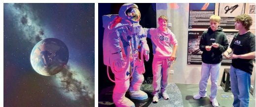
Ein Raumanzug zum Anfassen und eine «Reise ins All» zum Träumen...