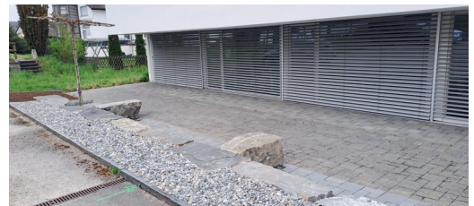
Neugestaltete Rückseite der Arche