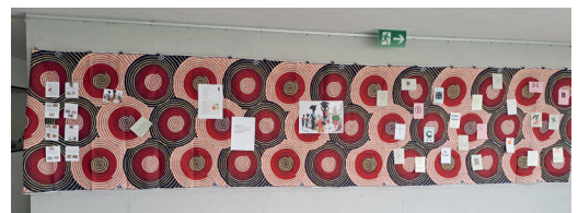
Erinnerung an den Weltgebetsstag der Kinder «Nigeria»