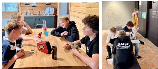
Wie Mönche lebten, wirkt auch wie eine fremde Welt.